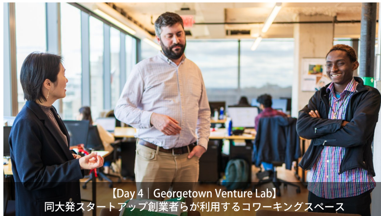
【Day 4 | Georgetown Venture Lab】 同大発スタートアップ創業者らが利用するコワーキングスペース