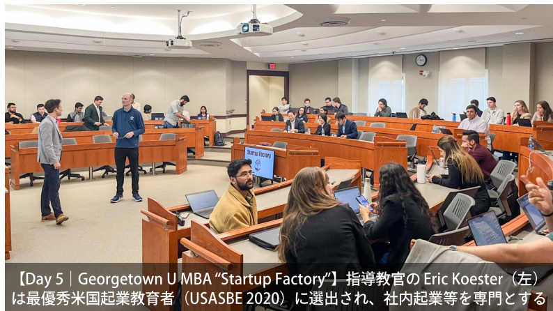
【Day 5 | Georgetown U MBA "Startup Factory"】指導教官のEric Koester (左) は最優秀米国起業教育者 (USASBE 2020) に選出され、社内起業等を専門とする