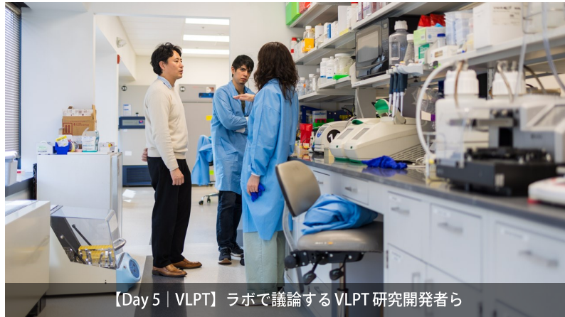
【Day 5 | VLPT】ラボで議論するVLPT研究開発者ら