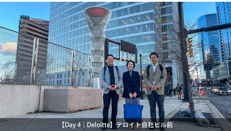
【Day 4 | Deloitte】 デロイト自社ビル前