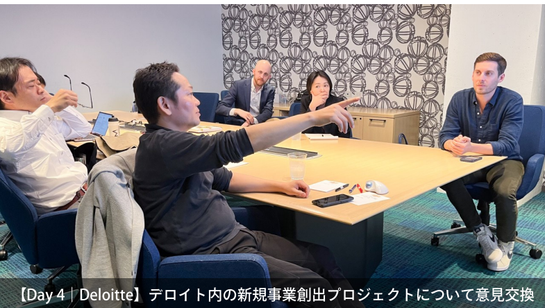
【Day 4 | Deloitte】 デロイト内の新規事業創出プロジェクトについて意見交換