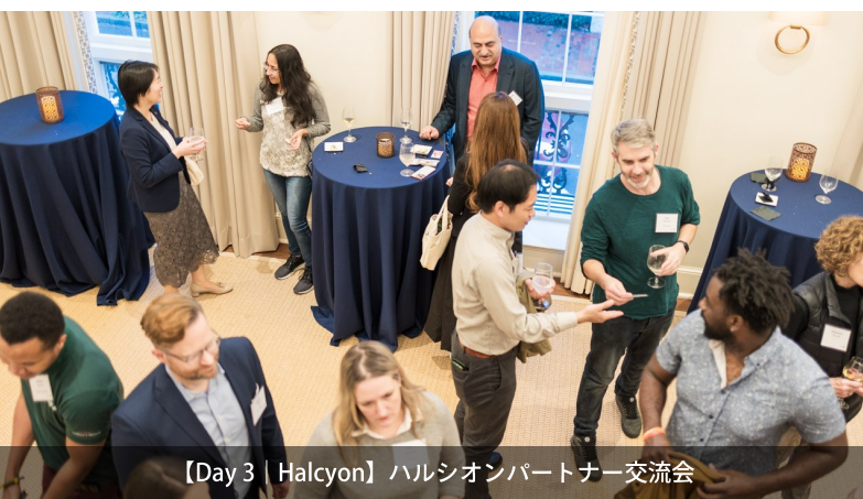
【Day 3 | Halcyon】ハルシオンパートナー交流会