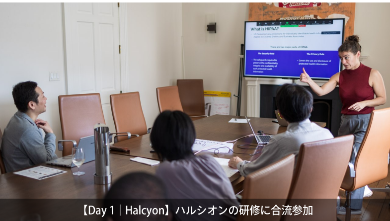
【Day 1 | Halcyon】ハルシオンの研修に合流参加

むアーティストや女性科学者等を支援する非営利組織です。同財団を会場として、ツアー参加者は自身の事業アイデア発表会、談話会、歓迎レセプションに臨みました。レセプションには来賓の山田重夫 駐米大使、フェニクススポンサー企業の北米駐在者、ハルシオン修了生・関係者、Washington Award 受賞音楽家など60名以上が出席しました。