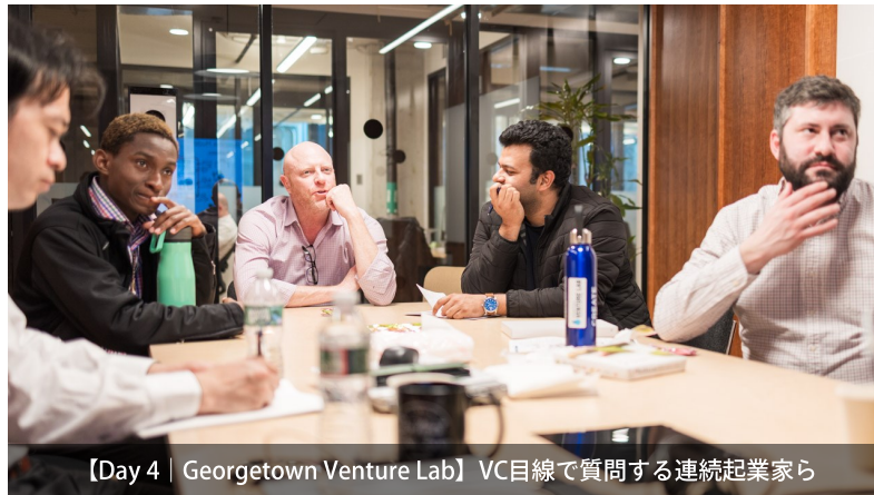
【Day 4 | Georgetown Venture Lab】 VC目線で質問する連続起業家ら