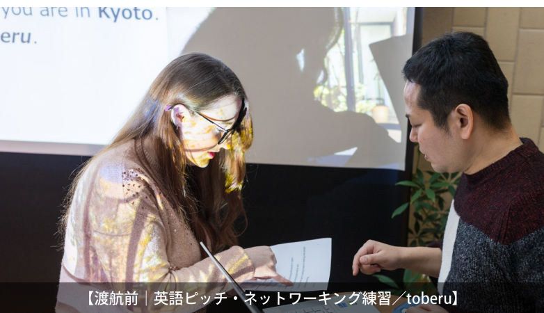
【渡航前 | 英語ピッチ・ネットワーキング練習 / toberu】