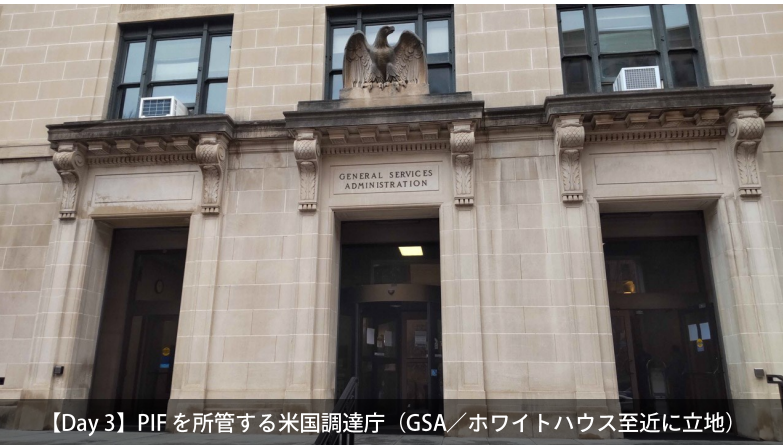
【Day 3】PIFを所管する米国調達庁 (GSA/ホワイトハウス至近に立地)