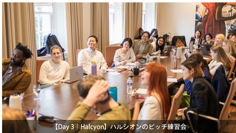
【Day 3 | Halcyon】ハルシオンのピッチ練習会