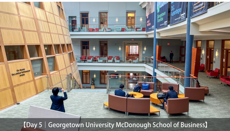
【Day 5 | Georgetown University McDonough School of Business】