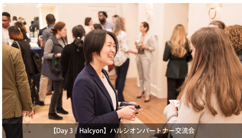
【Day 3 | Halcyon】ハルシオンパートナー交流会