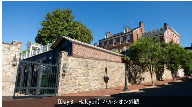
【Day 3 | Halcyon】ハルシオン外観