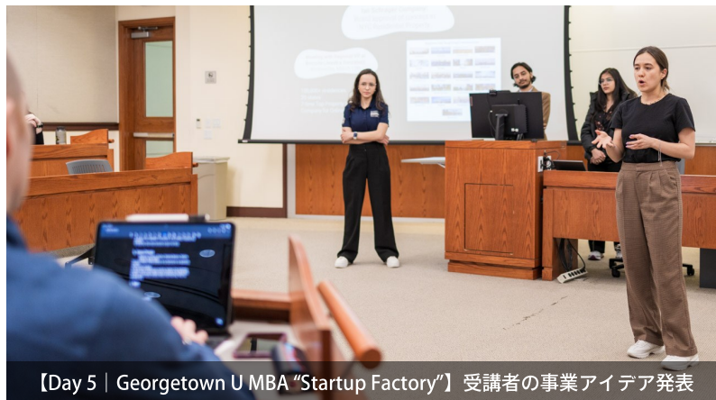
【Day 5 | Georgetown U MBA "Startup Factory"】受講者の事業アイデア発表