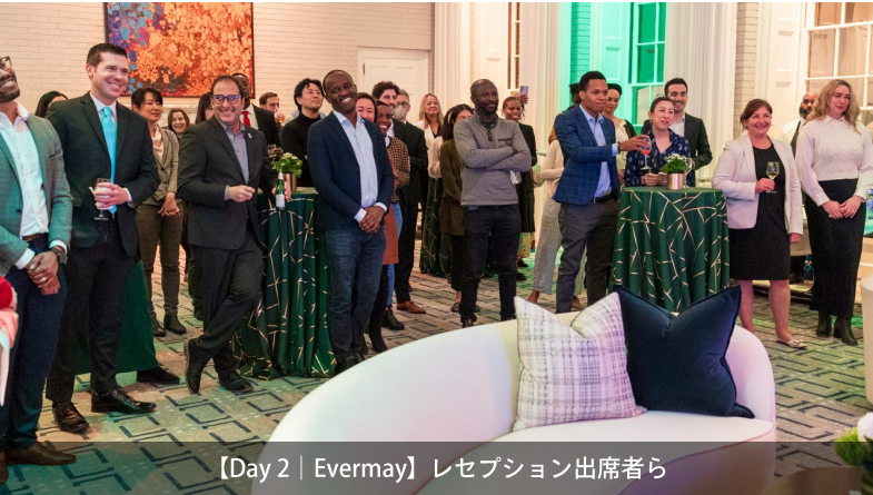
【Day 2 | Evermay】レセプション出席者ら