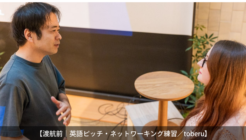
【渡航前 | 英語ピッチ・ネットワーキング練習 / toberu】