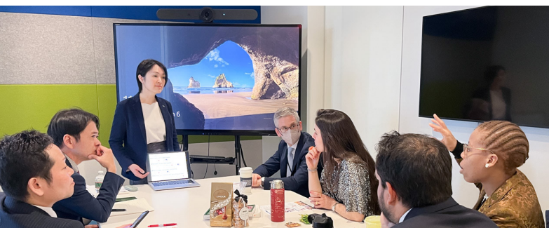
ホワイトハウス大統領イノベーションフェロー事業本部:他にジョージタウン大学 MBAスタートアップ講義、同大学ベンチャーラボ、テロイト等を訪問

米国首都圏スタートアップエコシステムを体感する「ハルシオン・DCツアー」。インプットだけでなくアウトプット (英語で事業発表・ネットワーキング等) も重視。第1回 (2024年3月) は修了生3名が参加、5日で8機関訪問、12会議・研修等に出席。