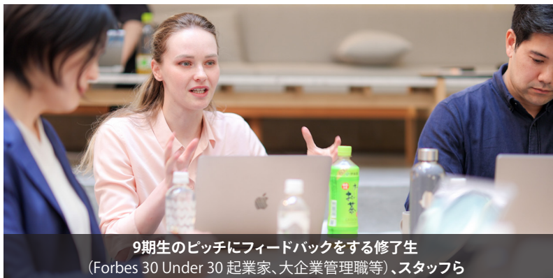
9期生のピッチにフィードバックをする修了生 (Forbes 30 Under 30 起業家、大企業管理職等)、スタッフら