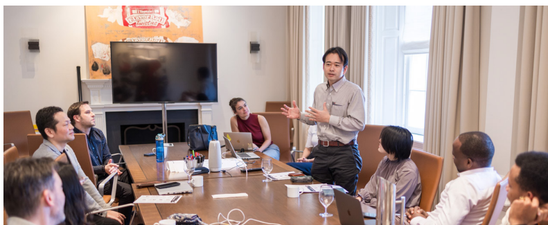
フェニクシーが居住滞在型インキュベータのモデルとしたハルシオン:コロンビア大学教授 (元 Sony US 重役) の研修、投資家らとのピッチ演習や交流会等に参加