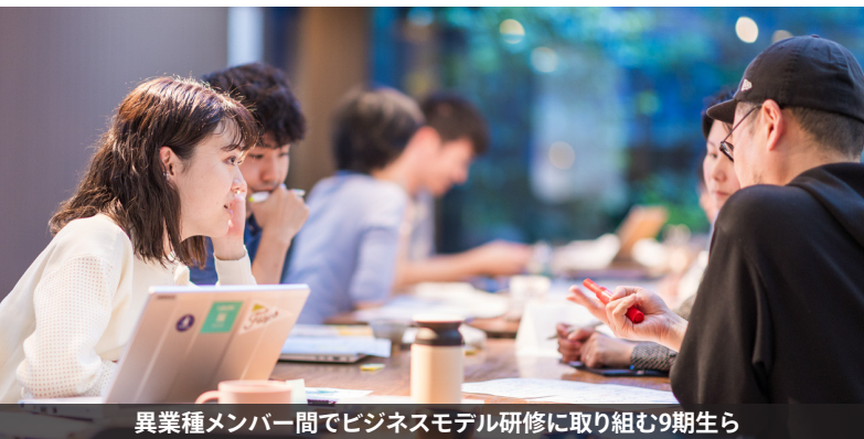
異業種メンバー間でビジネスモデル研修に取り組む9期生ら

*スポンサー企業枠と一般公募枠がある「インキュベーションプログラム」1～9期 + 一般公募のみの「ソーシャルイノベーションプログラム」1期 = 計10期分