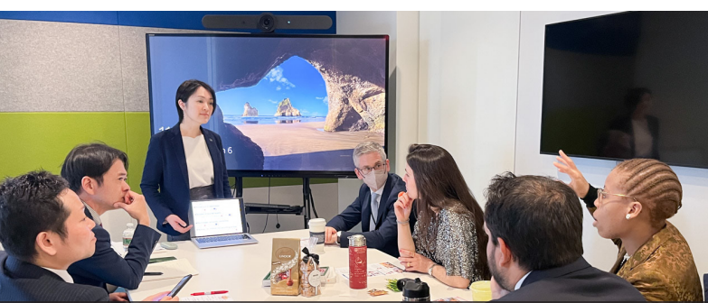
ホワイトハウス大統領イノベーションフェロー事業本部 | 他にジョージタウン大学 MBAスタートアップ講義、同大学ベンチャーラボ、テロイト等を訪問

米国首都圏スタートアップエコシステムを体感する「 ハルシオン・DCツアー 」。インプットだけでなくアウトプット (英語で事業発表・ネットワーキング等) も重視。第1回 (2024年3月) は修了生3名が参加、5日で8機関訪問、12会議・研修等に出席。